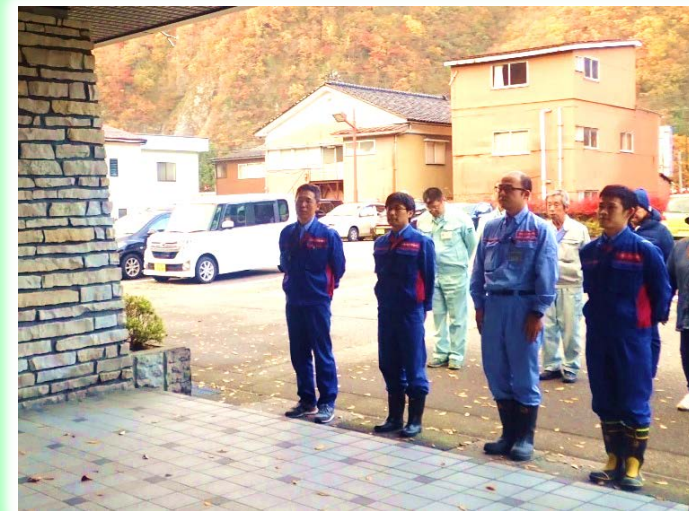
下山報告する出張所の皆さん

また、大雨での被災など、視察及び工事に影響するものもありましたが、天候にも恵まれ、重大な事故なく全員が無事に元気に下山しました。