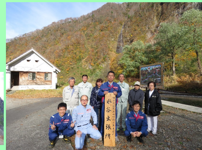
出張所の看板外し