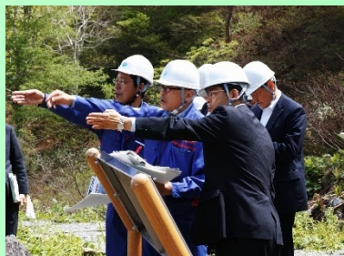
石井国土交通大臣視察