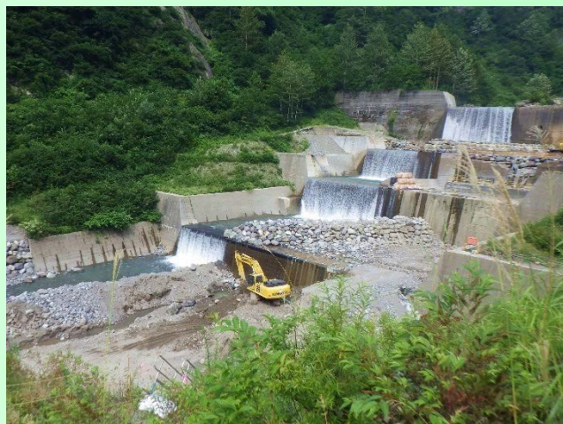
水谷第3号砂防堰堤工事現場