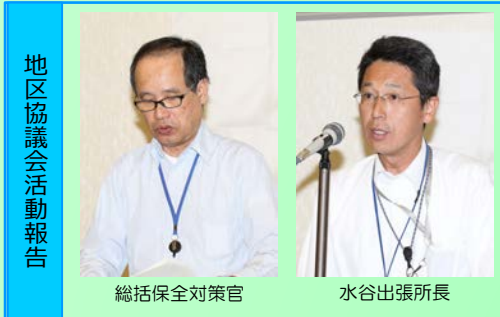
地区協議会活動報告