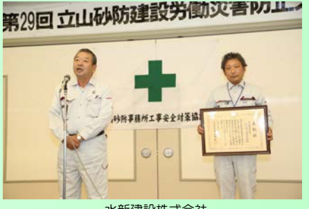
水新建設株式会社