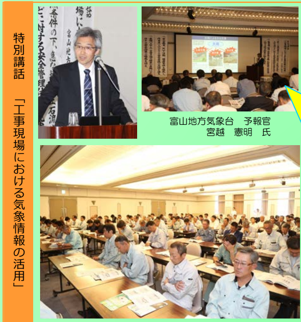
特別講話 「工事現場における気象情報の活用」