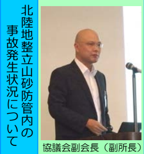
北陸地整立山砂防管内の事故発生状況についての報告