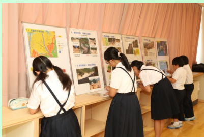
パネル展示にも興味津々