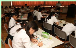
メモをとる児童達

今回の出前講座は、昨年度に引き続き「斜面防災対策技術協会富山支部」が主催となり、当事務所が支援しました(昨年度は、富山市立大庄小学校)。また、来る9月1日(金)には当事務所管内の現場を見学、9月27日(水)には土砂災害の模型等による講座も支援する予定です。