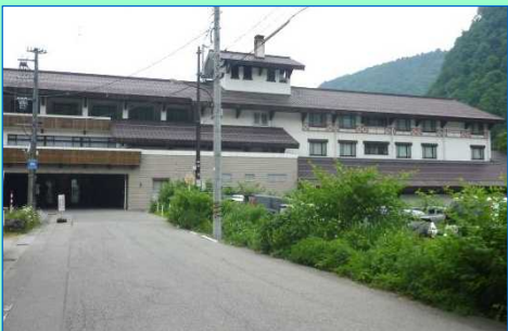
グリーンビュー立山