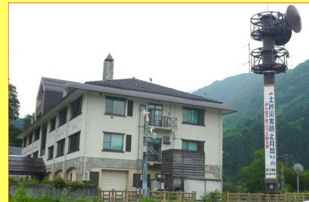
立山砂防事務所と懸垂幕