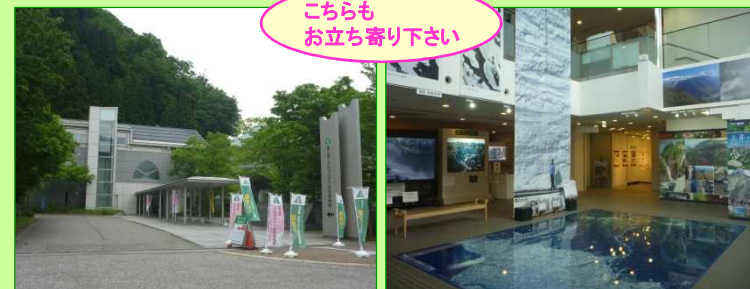
立山カルデラ砂防博物館