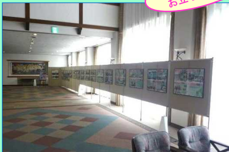
パネルの展示状況(1Fロビー)