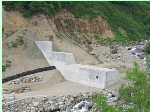
新湯第2号砂防堰堤工事現場