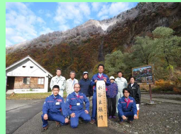
出張所の看板外し