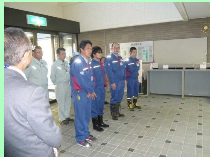
下山報告する出張所の皆さん

また、7月には台風12号による大雨での被災など、視察及び工事に影響するものもありましたが、天候にも恵まれ、重大な事故なく全員が無事に元気に下山しました。