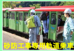
砂防工事専用軌道乗車