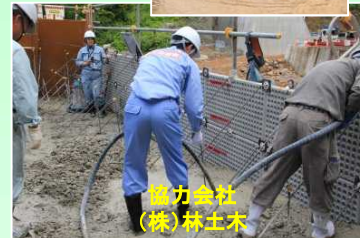
協力会社 (株)林土木