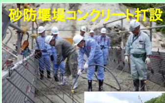
砂防堰堤コンクリート打設