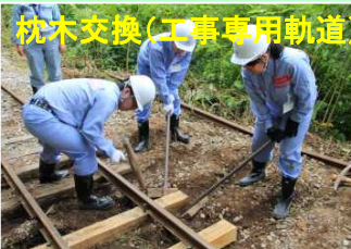
枕木交換(工事専用軌道)