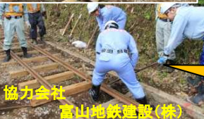
協力会社 富山地鉄建設(株)