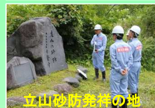
立山砂防発祥の地