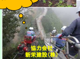
協力会社 新栄建設(株)