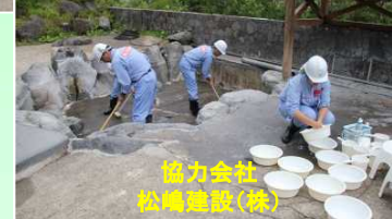
協力会社 松嶋建設(株)