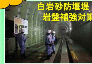
白岩砂防堰堤 岩盤補強対策