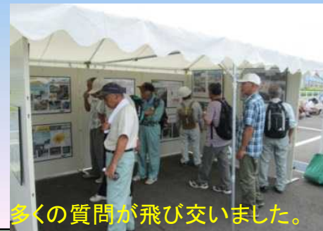
多くの質問が飛び交いました。