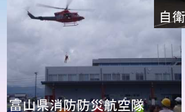
富山県消防防災航空隊