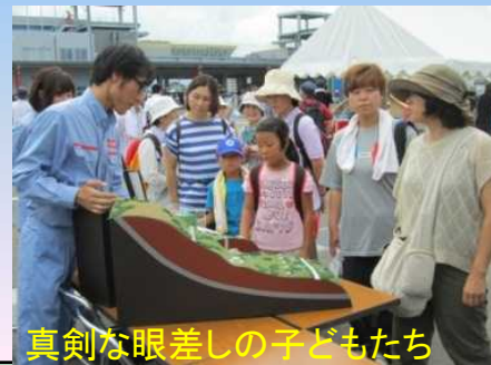
真剣な眼差し子どもたち