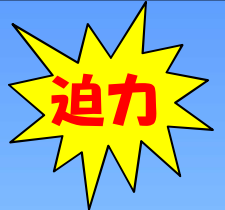
陸上自衛隊車両展示