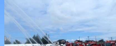
消防団一斉放水訓練