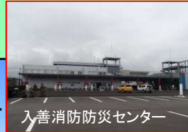
入善消防防災センター