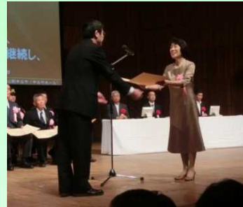
表彰を受ける尾畑会長