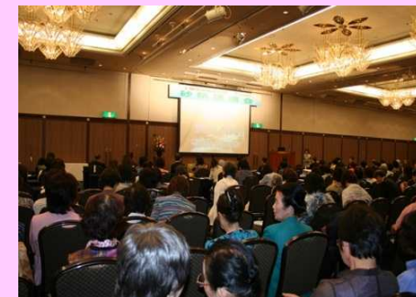
昨年度の「砂防講演会」の様子