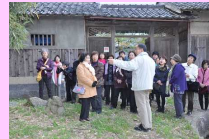
近隣砂防視察 (平成26年度赤木記念館)