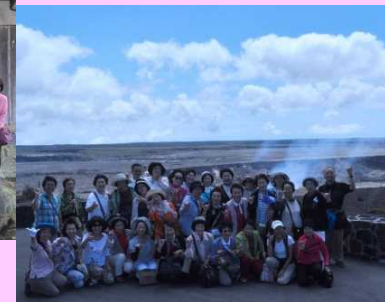
海外視察研修 (平成26年度ハワイ)