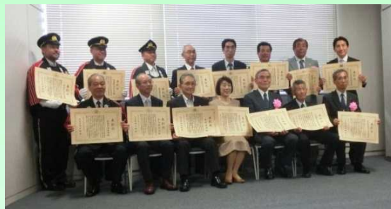
受賞を受けられた皆様で記念写真