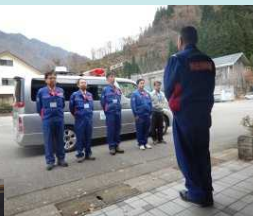
▲立山砂防事務所 出発式