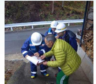
▲地元住民への被災状況聞取