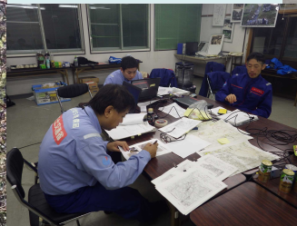
点検箇所の報告書整理▼