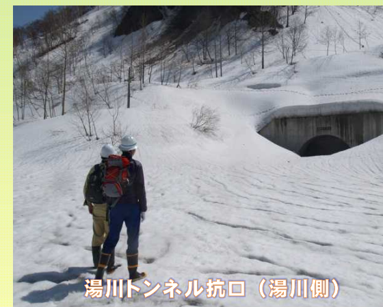
湯川トンネル抗口（湯川側）