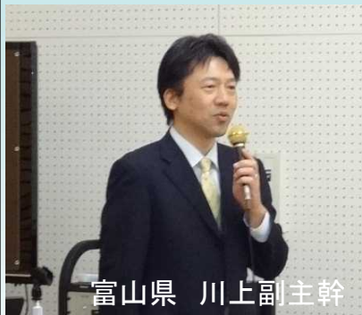
富山県 川上副主幹