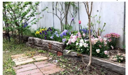
園芸用資材として、ご利用頂けます。