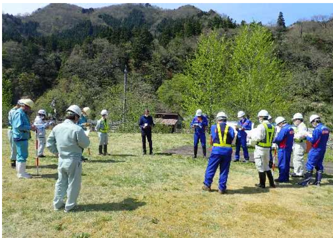
参加者15名での点検箇所・項目の確認 (常願寺川水辺の楽校)