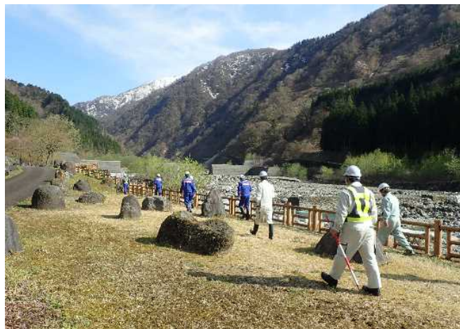
安全利用点検を行う参加者 (千寿ヶ原緑地公園)