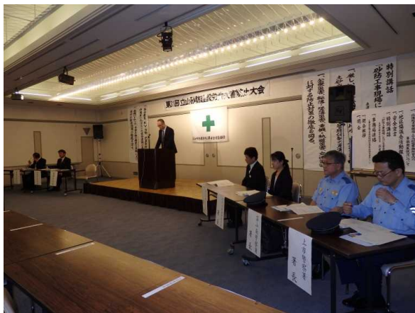
会場状況(ひな壇側)