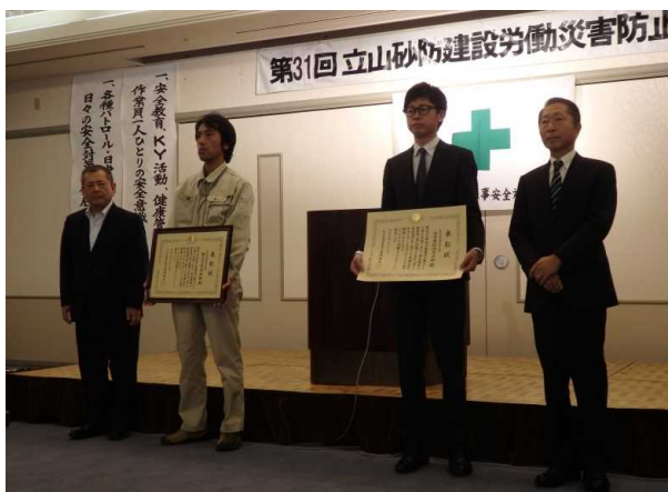
安全管理優良受注者紹介