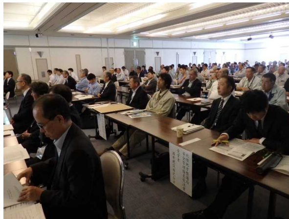
会場状況(会員席側)