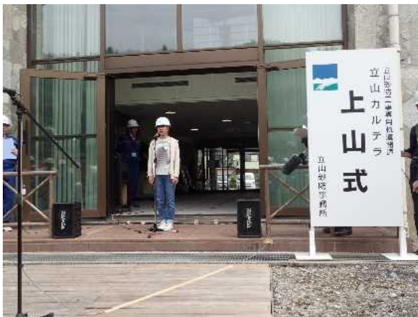
小学生による応援の言葉