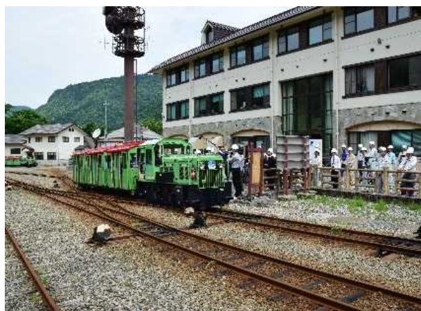
水谷へ向けて出発！