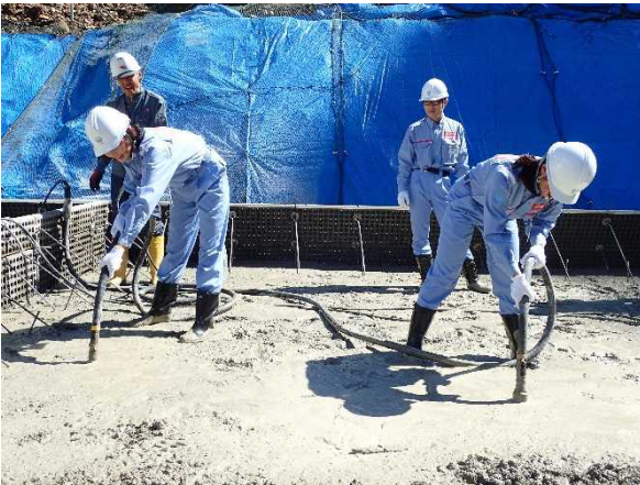
砂防工事現場体験1 (コンクリート打設体験)