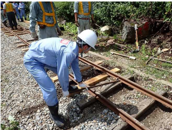
砂防工事現場体験3 (枕木交換体験)