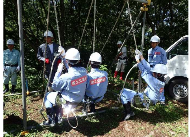
砂防工事現場体験2 (ロープ作業体験)