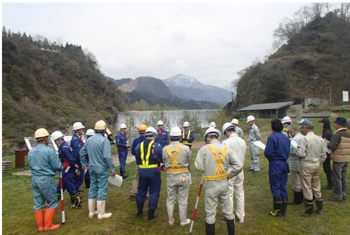
参加者27名での点検前の行程確認 (常願寺川水辺の楽校)