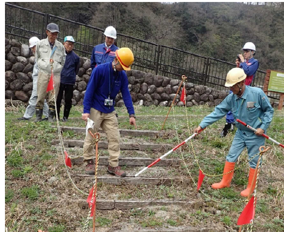
安全利用点検を行う参加者 (常願寺川水辺の楽校)