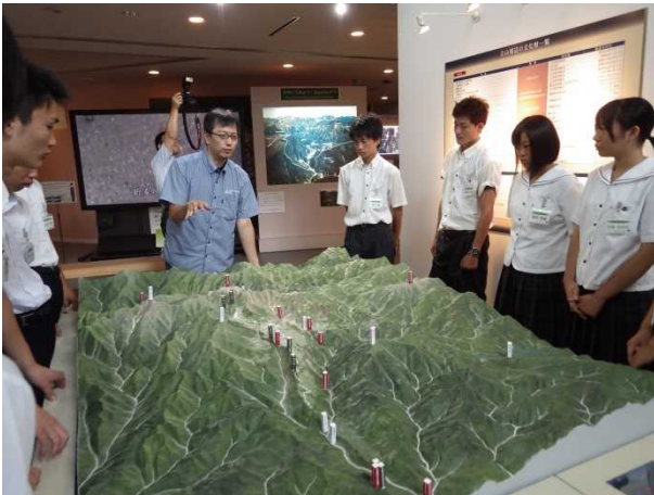
立山カルデラ砂防博物館見学