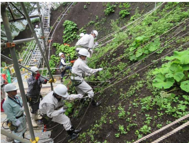
山腹工でのロープ作業