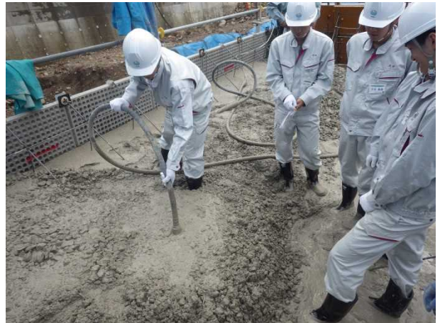
砂防堰堤のコンクリート打設