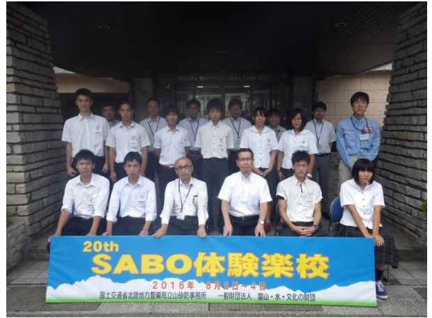
開校式後の記念撮影