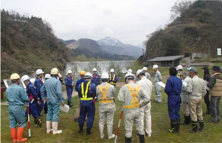
参加者27名での点検項目の確認 (常願寺川水辺の楽校)