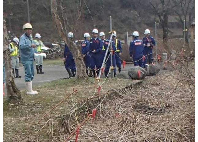
安全利用点検を行う参加者 (立山1号公園)