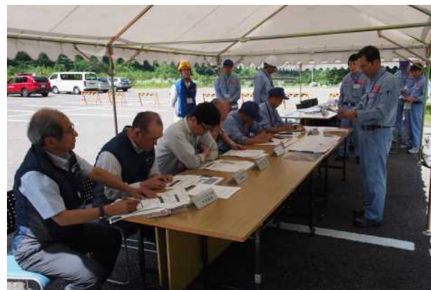
事故対策本部情報伝達（現地）