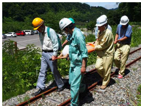
レスキューシートによる搬送（現地）