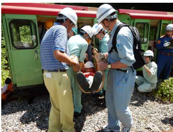
重傷者の応急手当、搬出（現地）