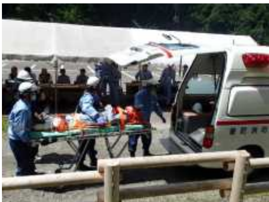
救急車による搬送（現地）