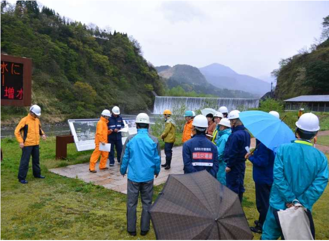
参加者26名での点検前の行程確認 (常願寺川水辺の楽校)