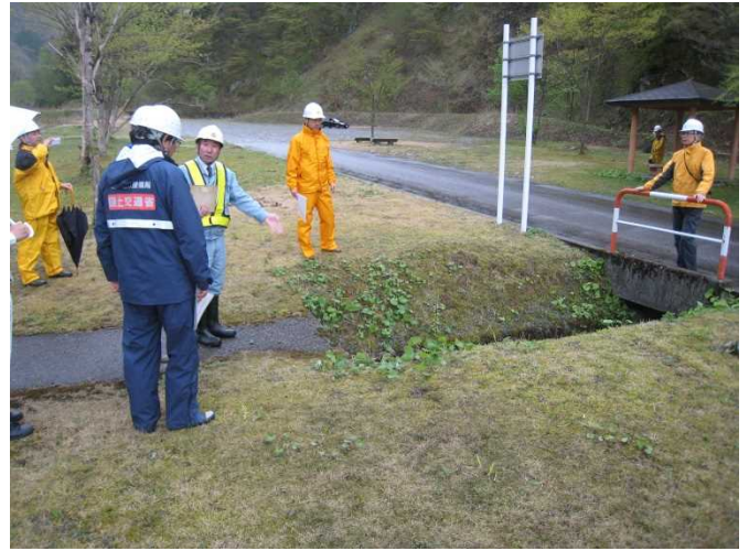
安全利用点検を行う参加者 (立山1号公園)