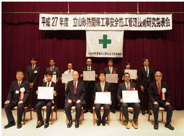
受賞者との記念撮影