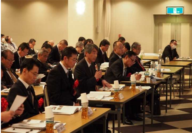
発表会の様子(219名の参加)