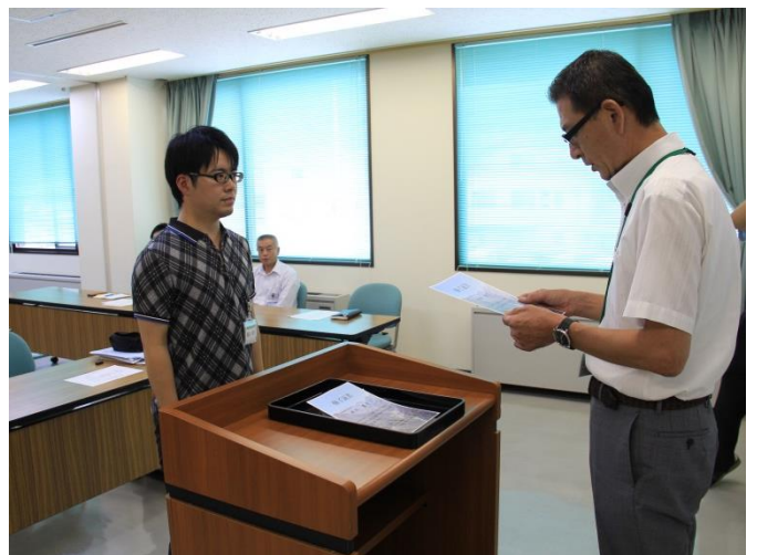
閉講式 (修了証書授与)