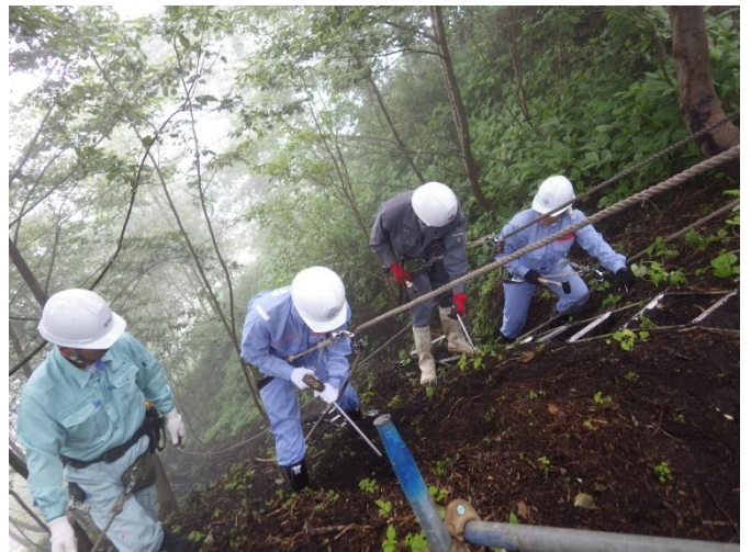
山腹工事 (ロープ作業体験)