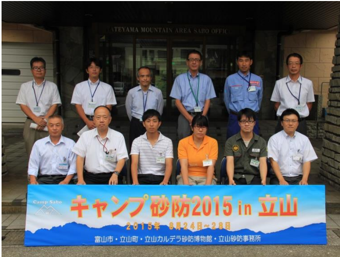
開講式の記念撮影