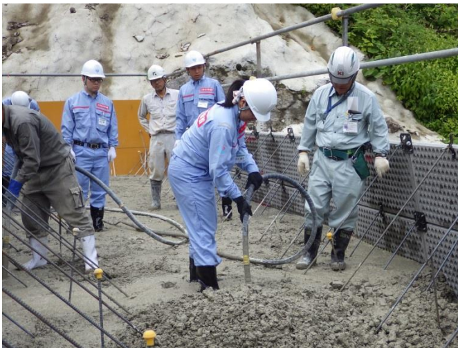
砂防堰堤工事 (コンクリート打設体験)