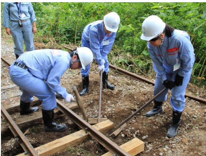
工事専用軌道 (枕木交換体験)