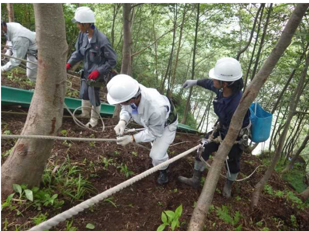
山腹工でのロープ作業