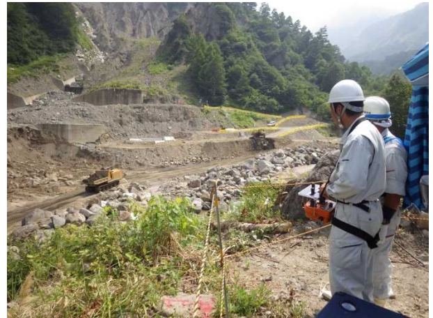
無人化施工での遠隔操作