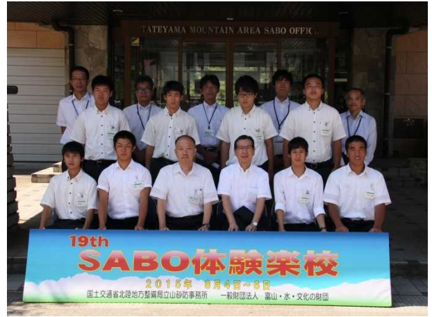
開校式後の記念撮影