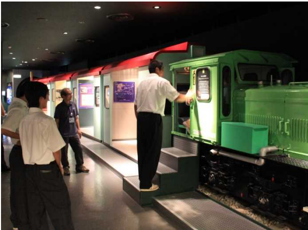
立山カルデラ砂防博物館見学