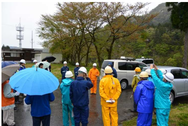
参加者26名での点検前の行程確認 (常願寺川水辺の楽校)