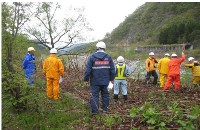
安全利用点検を行う参加者 (立山1号公園)