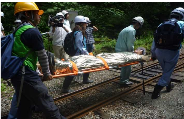
レスキューシート搬送訓練（現場）