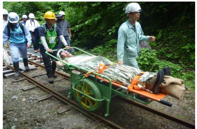
レスキューカート（軌道用）による搬送訓練（現場）