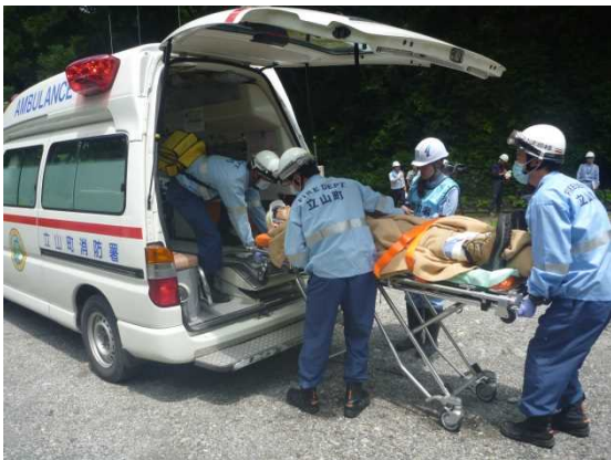
救急車による搬送訓練（現場）