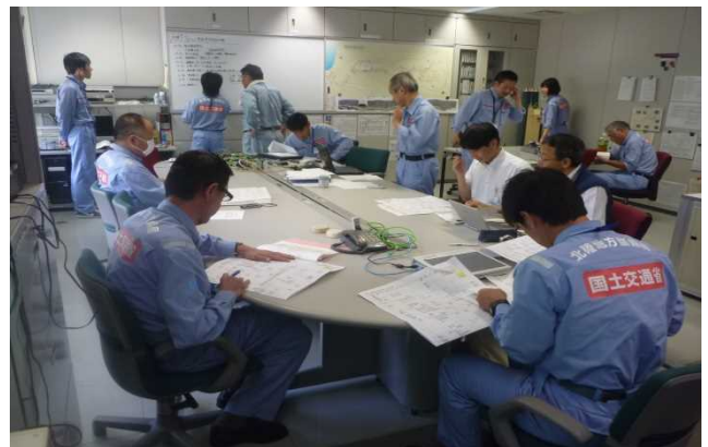
事故対策本部情報伝達（立山砂防事務所内）