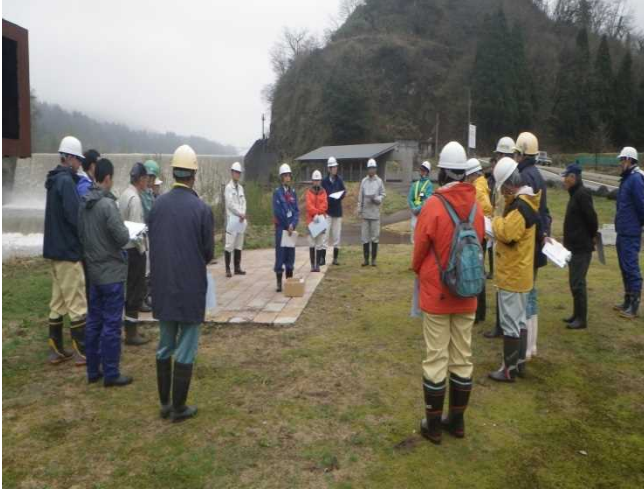
参加者22名での点検前の行程確認 (常願寺川水辺の楽校)