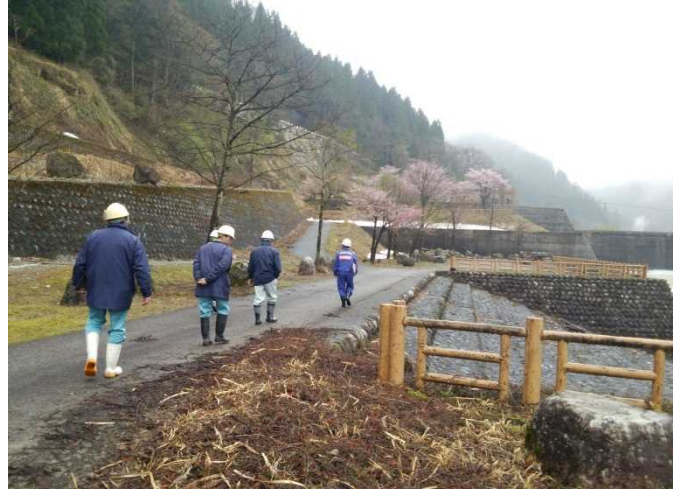
安全利用点検を行う参加者 (千寿ヶ原緑地公園)