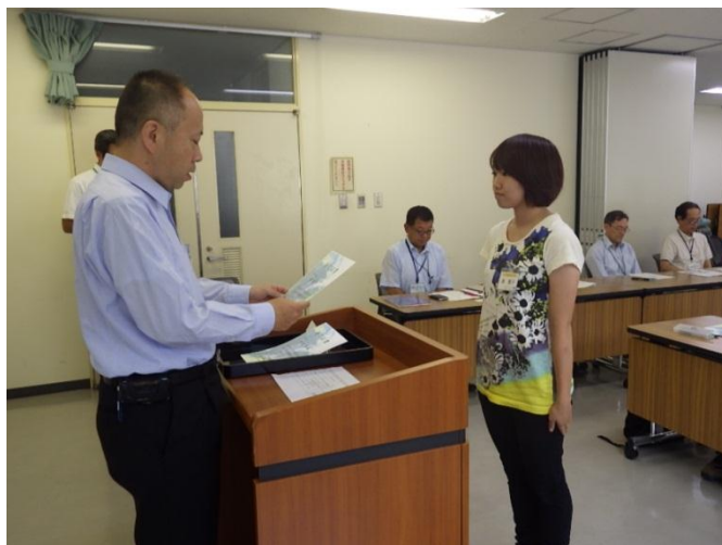
閉講式 (修了証書授与)