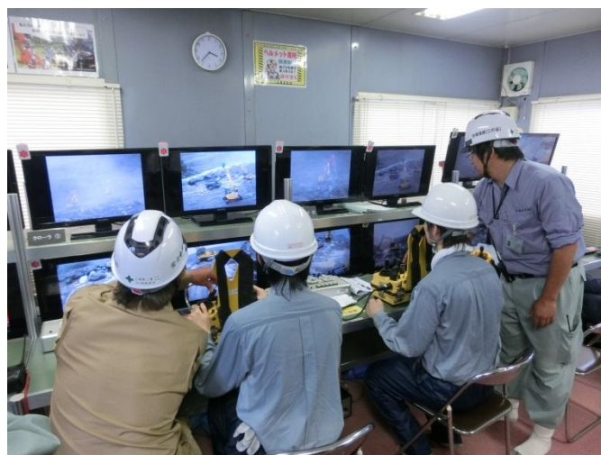
無線操縦 (無人化施工体験)