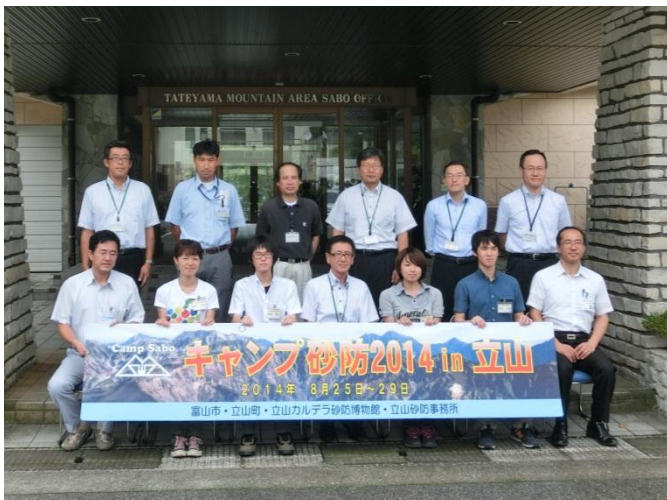
開講式の記念撮影