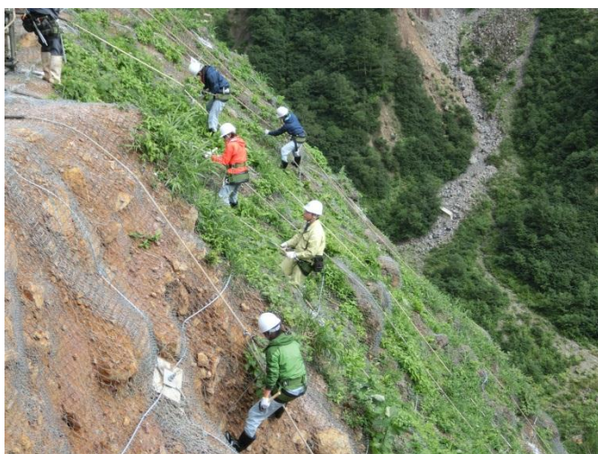
山腹工 (斜面对策体験)