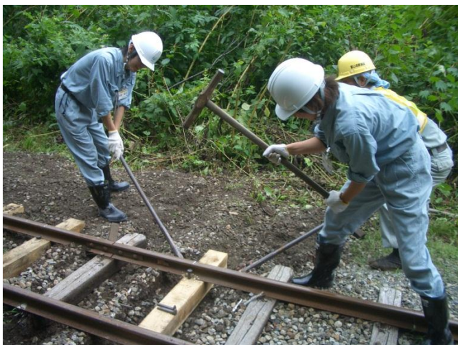
工事専用軌道 (枕木交換体験)