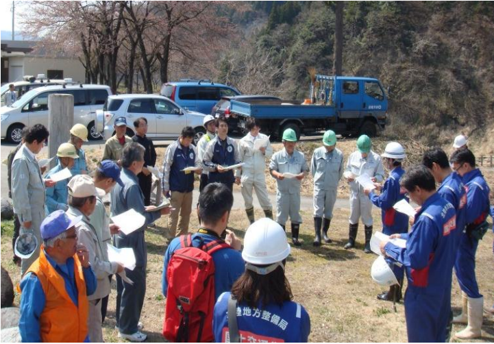
参加者22名での点検前の行程確認 (常願寺川水辺の楽校)