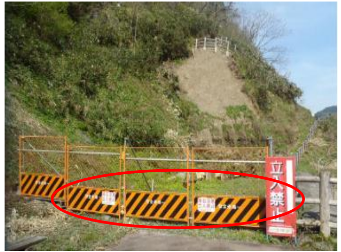
通行止措置状況 (常願寺川水辺の楽校)