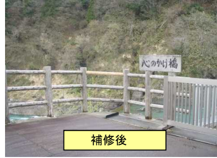
損傷した転落防止柵を補修 (常願寺川水辺の楽校)