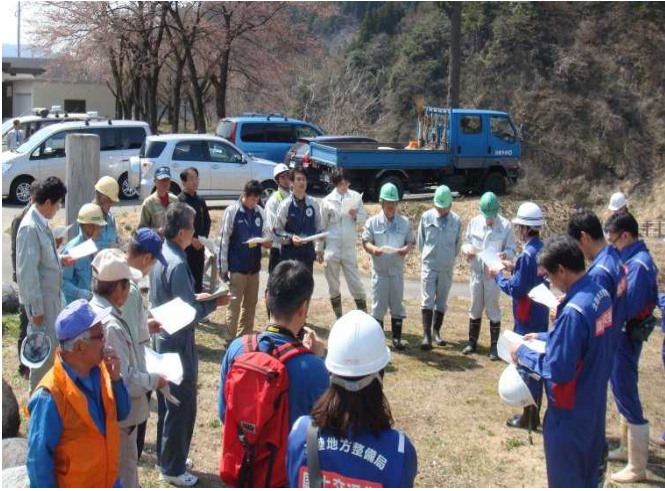
参加者26名での点検前の行程確認 (常願寺川水辺の楽校)