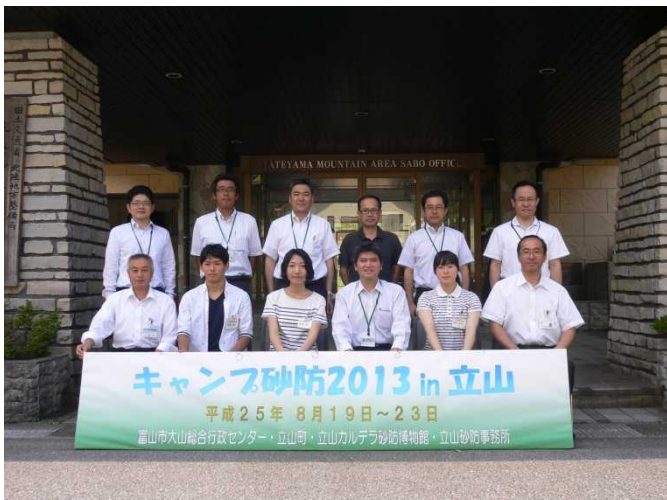
開講式の記念撮影