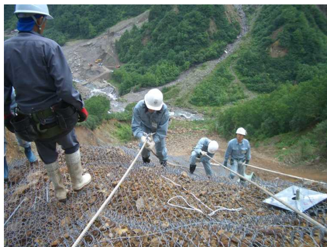
山腹工 (斜面对策体験)