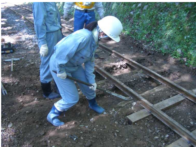
工事専用軌道 (枕木交換体験)