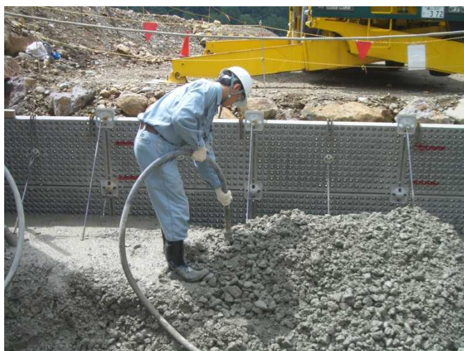
砂防堰堤 (コンクリート打設体験)