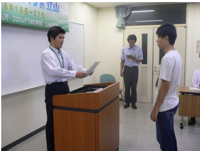
閉講式 (修了証書授与)