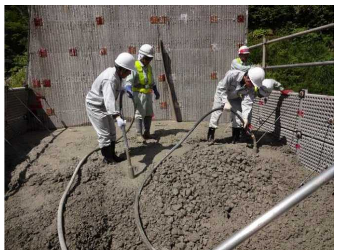
砂防堰堤のコンクリート打設