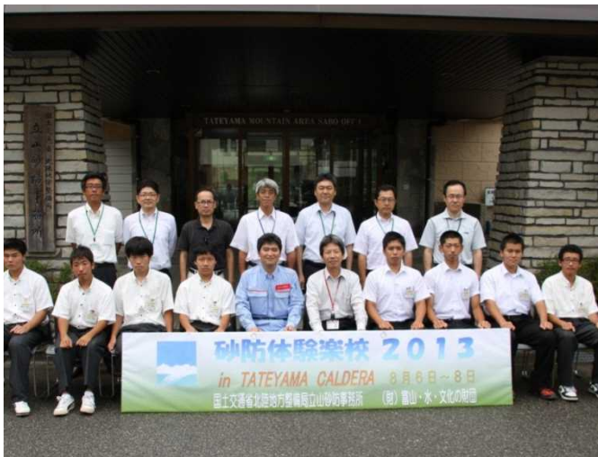
開校式後の記念撮影