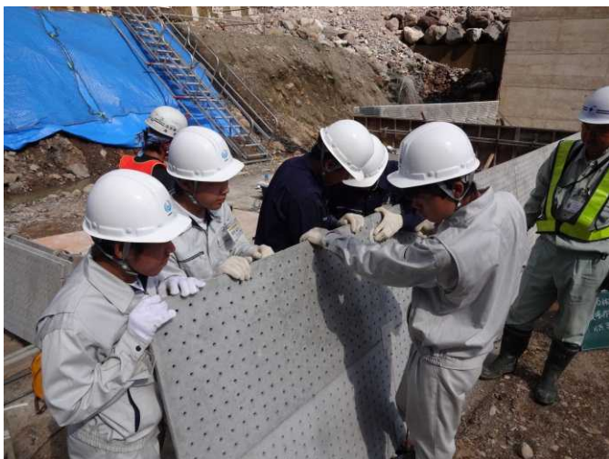
砂防堰堤の型枠設置