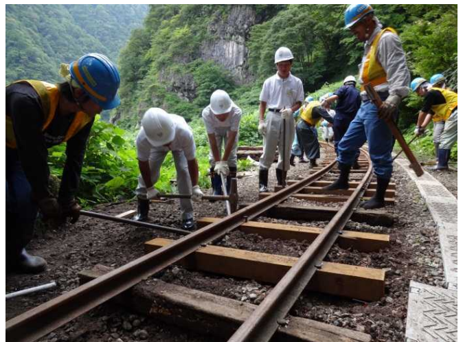
枕木交換(工事専用軌道)