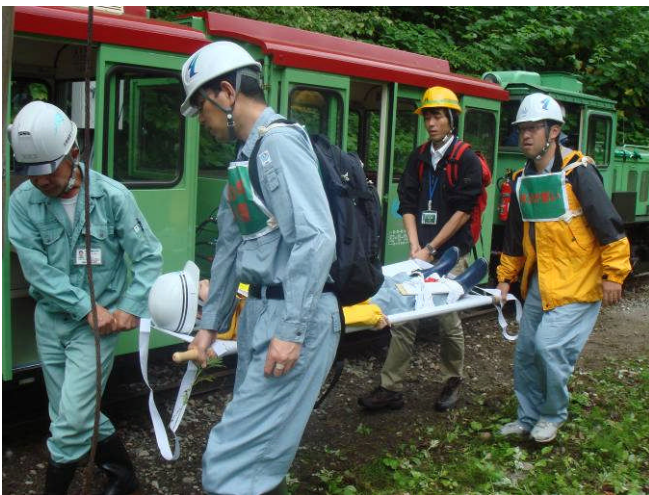
担架で搬送訓練(現場)