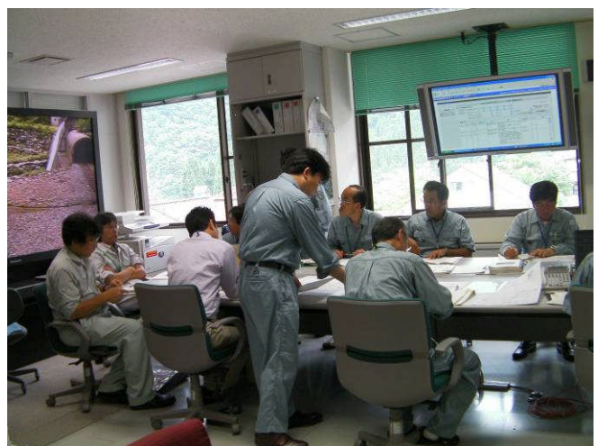
災害対策支部情報伝達(立山砂防事務所にて)