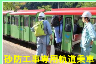
砂防工事専用軌道乗車