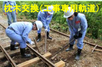
枕木交換(工事専用軌道)