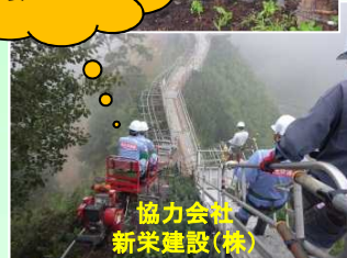
協力会社 新栄建設(株)