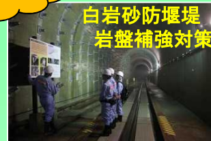
白岩砂防堰堤 岩盤補強対策