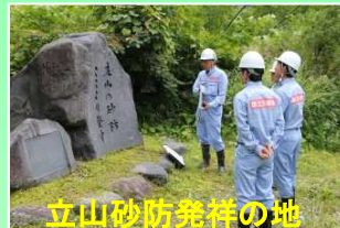
立山砂防発祥の地