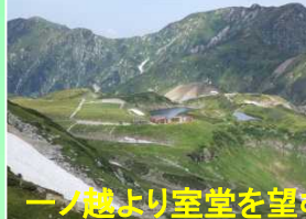
一ノ越より室堂を望む