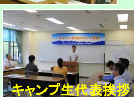
キャンプ生代表挨拶