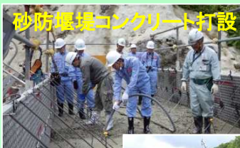
砂防堰堤コンクリート打設