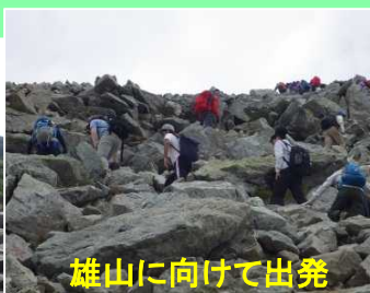
雄山に向けて出発