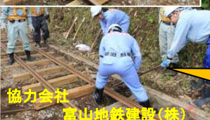
協力会社 富山地鉄建設(株)