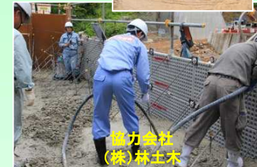
協力会社 (株)林土木