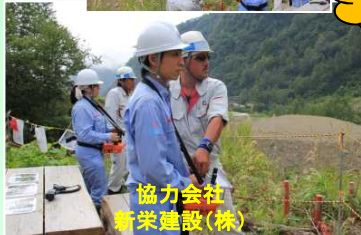
協力会社 新栄建設(株)