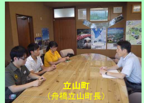
立山町 (舟橋立山町長)