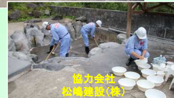
協力会社 松嶋建設(株)