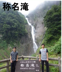
日本一の落差を誇る