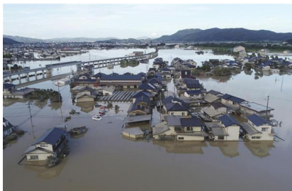
平成30年7月 岡山県真備町 河川氾濫