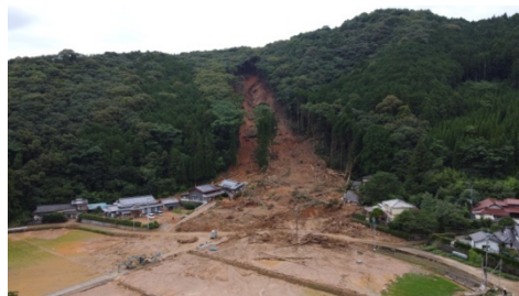
令和2年7月 熊本県芦北町 土砂くずれ