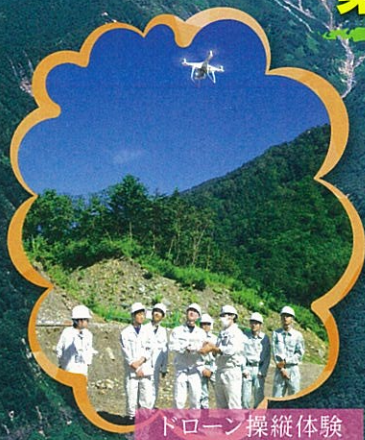
ドローン操縦体験