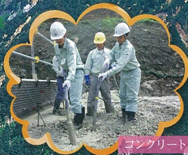
コンクリート打設体験