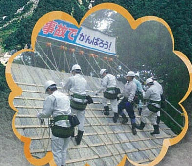
山腹工ロープ作業体験