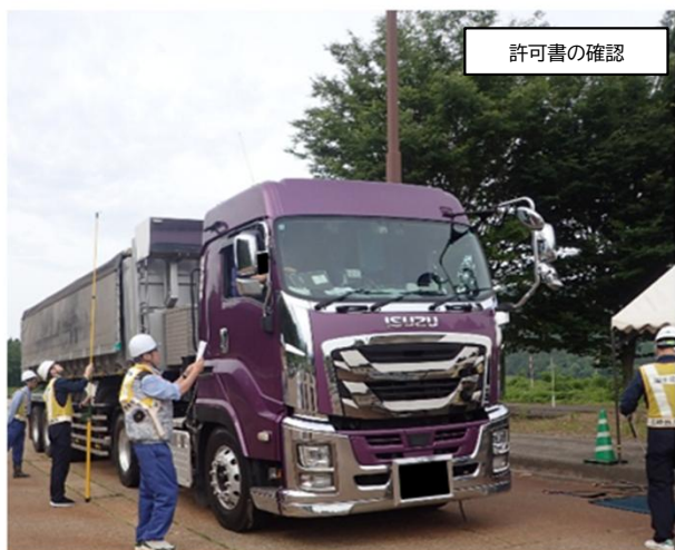
※写真の車両は違反車両ではありません