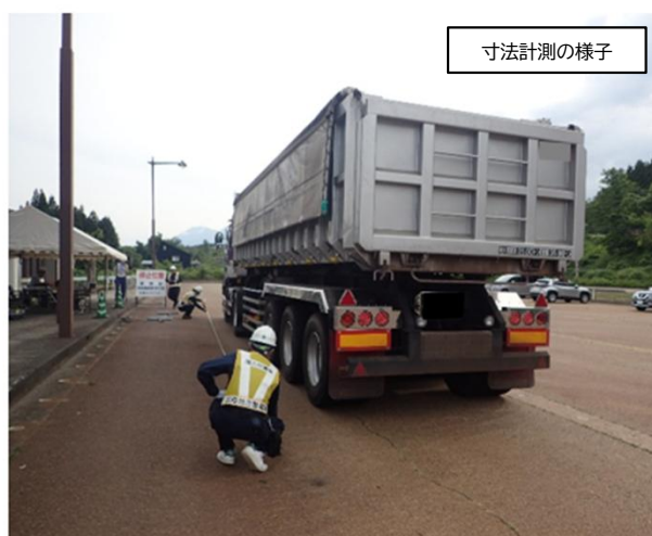
※写真の車両は違反車両ではありません