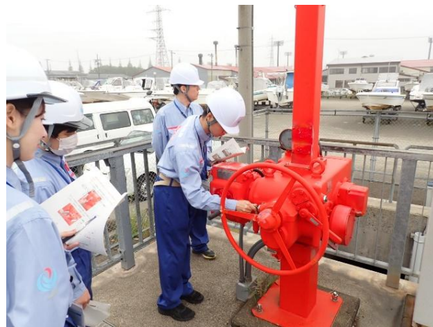
春日新田川排水機場でのゲート操作状況