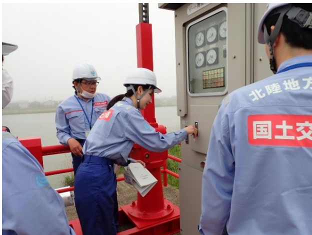
東雲町排水樋管でのゲート操作状況