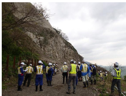
洞門上斜面の点検状況