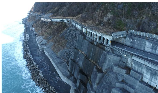
むかいやま 糸魚川市向山洞門付近の状況