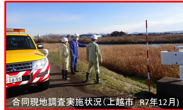
合同現地調査実施状況(上越市 R7年12月)