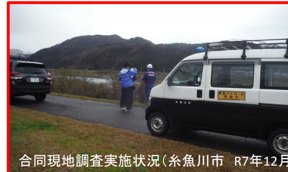
合同現地調査実施状況(糸魚川市 R7年12月)