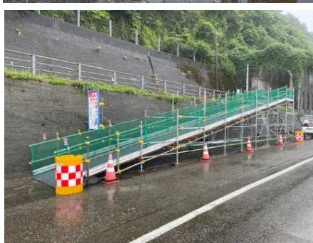
(糸魚川側 規制状況)