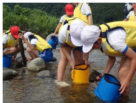
川にすむ生きものを採集

詳細は、 https://www.mlit.go.jp/report/press/mizukokudo04_hh_000237.html