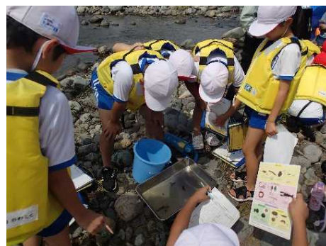
採集した水生生物を判定