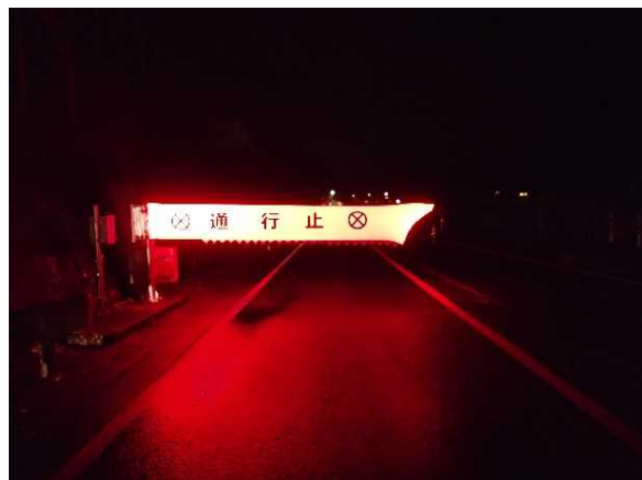
◆交通遮断機の展開状況