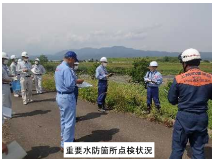
重要水防箇所点検状況