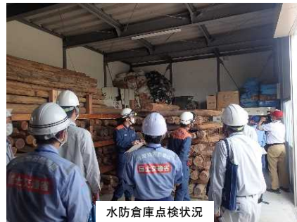
水防倉庫点検状況