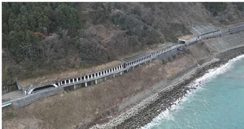
糸魚川市三段滝地先付近の状況