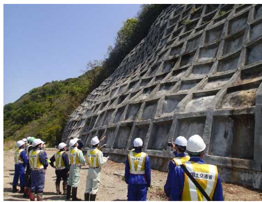
洞門上斜面の点検状況