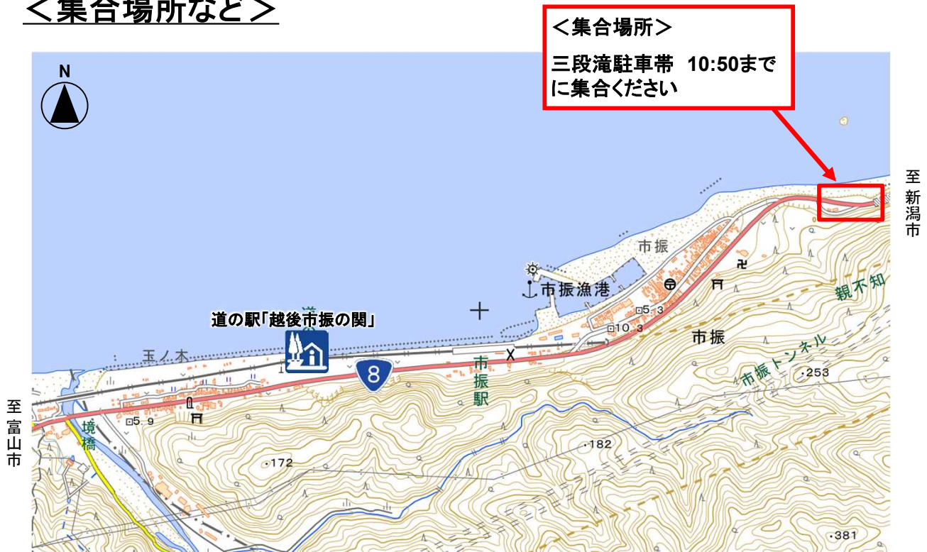
三段滝駐車帯付近 拡大図