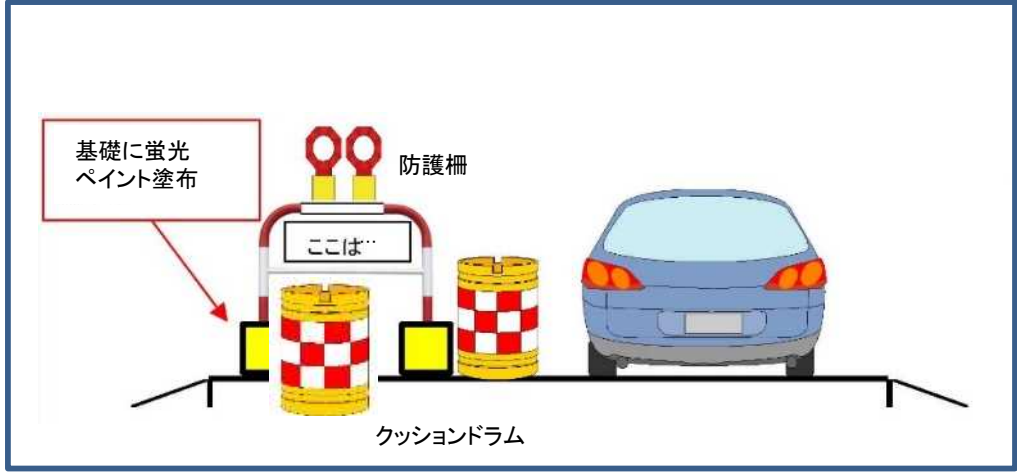
防護柵等設置標準図

※地図上の①～④は防護柵とクッションドラムを設置し、⑤はクッションドラムのみを設置する。