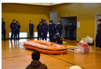
消防団による救命ボートの実演