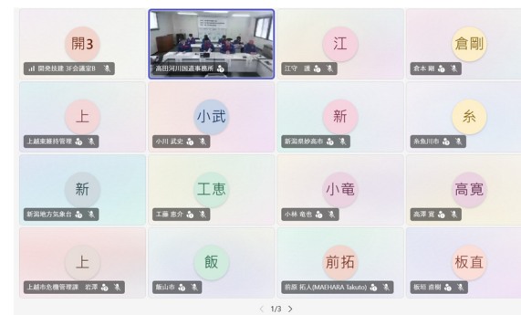
第6回 関川・姫川流域治水協議会 実施状況