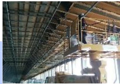
洞門内の梁部材補修状況