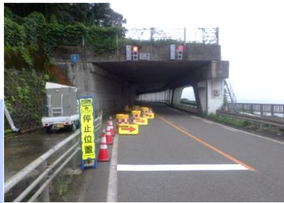
信号規制箇所のイメージ