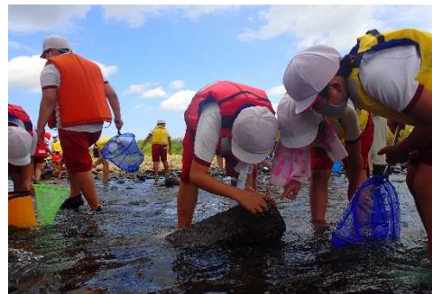
川にすむ生きものを採集