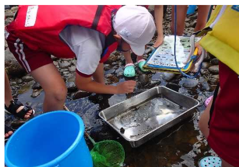
採集した水生生物を判定

※現地での取材の制限はございませんが、ライフジャケットなどの安全用具の着用等をお願いいたします。